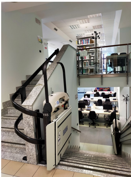
Biblioteca del Dipartimento di Scienze del Farmaco, Novara, Largo Donegani 2/3 (Palazzina Wild 2)

Invece nel 1851 per ossidazione fotochimica dell'essenza di trementina ottenne un idrato di terpinina, chiamato poi in suo onore sobrerolo , ancora oggi usato come stimolante respiratorio. Il sobrerolo è probabilmente il primo glicole terpenico C_nH_{n-4}(OH)_2 conosciuto.